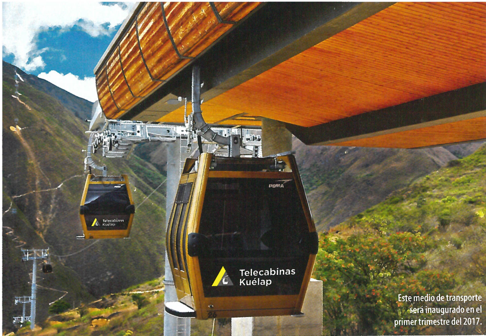
Este medio de transporte será inaugurado en el primer trimestre del 2017.